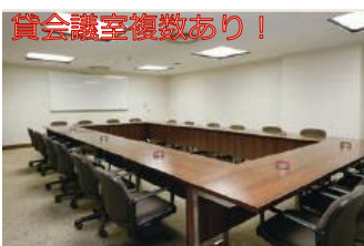
B2F 第二会議室 A