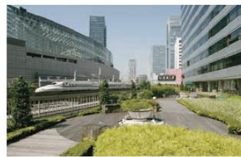
3F 有楽町コリヤ(屋上庭園)